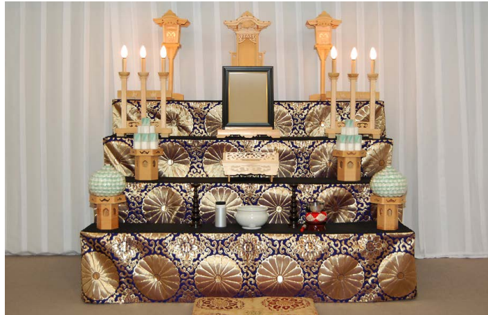
祭壇サイズ 幅 180cm 金欄四段飾り