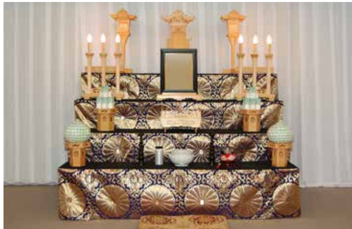
祭壇サイズ 幅 1,800 mm 金欄四段飾り